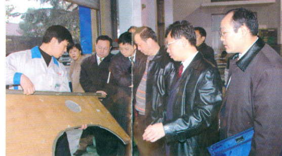
考察常州颖西汽车内饰件有限公司