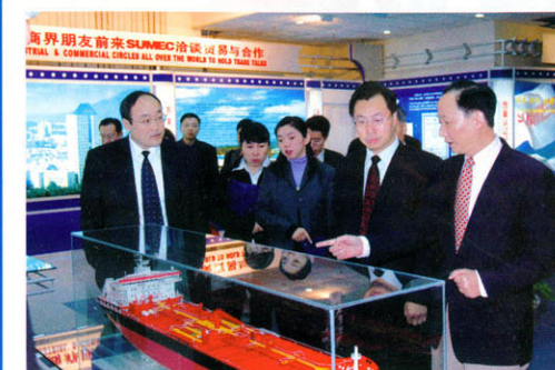
参观江苏苏美达集团公司产品陈列室及产业基地