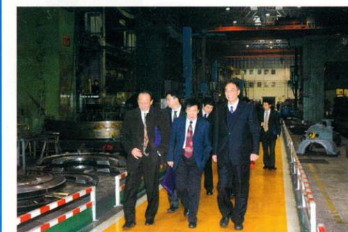
参观南京汽轮机(集团)有限责任公司生产车间