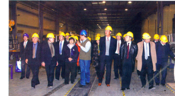
考察查特中汽深冷特种车(常州)有限公司