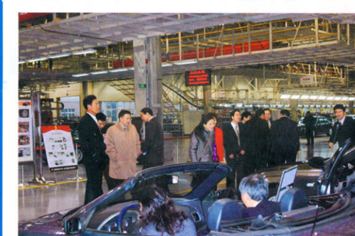
参观南京汽车集团公司名爵汽车生产线