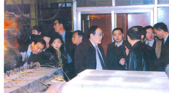
考察常州威士顿有限公司