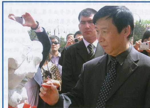
于洪君大使为展会开幕式“点睛”

参展商叶穗生撰书 乌兹别克斯坦副总理 汉诺夫题词: 这是个很有意义的展览,我认为它将增进中乌两国的友好合作。 2008年3月28日