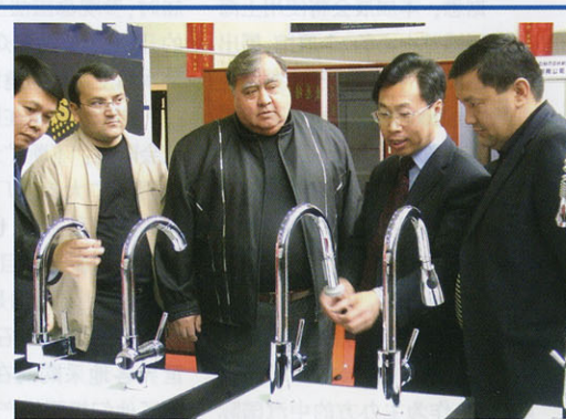
刘敬楨总裁向乌总统助理和总理助理介绍中国名优产品