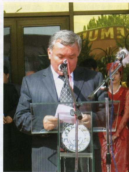
乌兹别克斯坦副部长玛哈季耶夫在开幕式上致辞