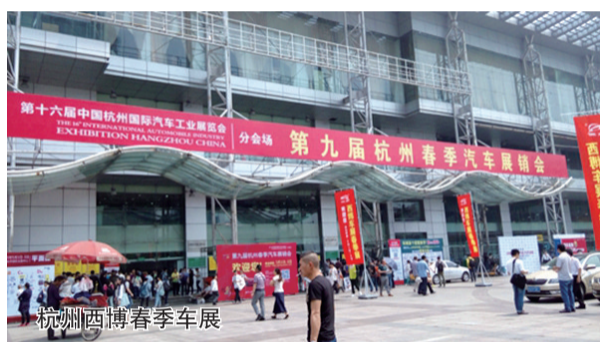
杭州西博春季车展

继公司第一个车展“中国(洛阳)汽车文化博览会”拉开会展序幕之后,五月初夏之时,公司展会陆续在全国各地绽放:杭州西博春季车展、东莞春季国际车展、锦州车展、合肥车展、贵阳车展、昆明汽配会、重庆摩配会等,为国内展会市场奉献了一场场精彩的汽车盛宴。