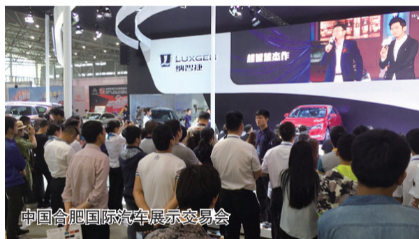
中国合肥国际汽车展示交易会