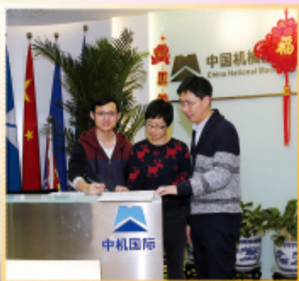
各职能部门同事坚守值班岗位