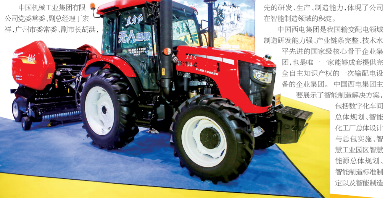
雷坤 张莉莉/文