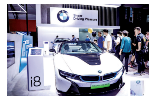
雷坤 张莉莉/文

8月26-30日,2020年内蒙古地区第一场大型国际汽车展览会——第十二届呼和浩特国际车展暨新能源汽车产业博览会(简称呼和浩特国际车展)在内蒙古国际会展中心举办。本届展会由中国机械国际合作股份有限公司(简称中机国际)主办。开幕当天,内蒙古呼和浩特市商务局党组书记、局长李红,中机国际党委书记、董事长夏闻迪出席展会并巡馆。8月27日中机国际总经理赵立志到展会现场重点检查疫情防控,会展传播国机集团品牌等工作,副总经理程永顺参加上述活动。 本届车展启用了内蒙古国际会展中心全馆及南北广场,共展出燃油汽车、新能源汽车、房车、摩托车827台,78个国内外汽车品牌、92家经销商,21家相关产业参展商;总展览面积超过7万平方米,展期5天接待观众突破15万人次,现场销售及订单量5670台,意向成交额达11.3亿元人民币。