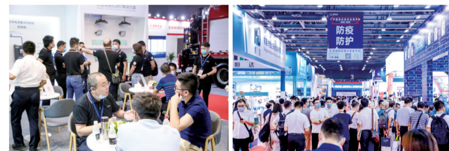
雷坤 张莉莉/文

圈,助力产业界、学术界的交流合作,打造高品质展会,共同提升国际国内影响力,促进形成国内国际双循环新格局,为我国华南地区、粤港澳大湾区应急安全产业经济复苏做出积极贡献。 本届展会由中国机械工业集团有限公司、住房和城乡建设部防灾研究中心、国家建筑工程技术研究中心、新际际华集团有限公司、国际应急管理学会、广东省安全生产协会、广东省应急协会、广东省消防协会、广东省应急产业协会、广东省气象防灾减灾协会、深圳市防雷协会共同主办,中国机械国际合作股份有限公司、广州立升展览服务有限公司、广州海骏会展商务有限公司联合承办,中国机床总公司协办。 黄福乾 任紫涵/文