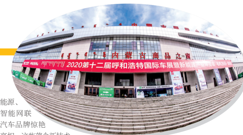
雷坤 张莉莉/文

除传统能源领域新车外,本届车展也是国内外各大汽车品牌的新能源产品秀。各参展商纷纷展出旗下新能源产品,众多品牌搭建的展台也凸显了环保概念。在新能源主题展馆内,奥迪、宝马、理想、比亚迪、荣威、MG、奇瑞、吉利等国内外主流新