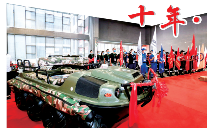
雷坤 张莉莉/文