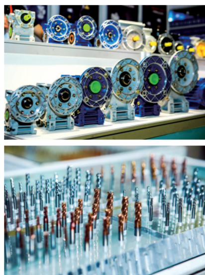
雷坤 张莉莉/文

机器人、服务机器人、娱乐机器人、无人车、智能穿戴产品、机器人开发平台与软件技术、机器人功能部件及零部件、机器人应用产品与智能工厂全套解决方案、工业自动化、数控机床及金属成型、3D打印技术与设备、工业物联网与未来工业、传感器技术与应用、以及智能装备和制造技术相关的高端产品、新兴技术和智能制造整体解决方案。 中国一拖携东方红 LF2204 动力换挡拖拉机、LF1104-C 无人驾驶拖拉机、东方红收获机、东方红四柴油机、东方红农具、传动系、国内首台“5G+”氢燃料电池电动拖拉机 ET504-H、大数据服务系统平台等惊艳亮相,全方位展示了行业领先的研发、生产、制造能力,体现了公司在智能制造领域的积淀。 中国西电集团是我国输变电领域制造研发能力强、产业链条完整、技术水平先进的国家级核心骨干企业集团,也是唯一一家能够成套提供完全自主知识产权的一次输变电设备的企业集团。中国西电集团主要展示了智能制造解决方案,包括数字化车间总体规划、智能化工厂总体规划与总包实施、智慧工业园区智慧能源总体规划、智能制造标准制定以及智能制造