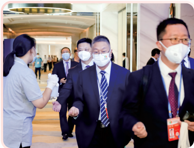
▲派发消毒液,严格防控疫情