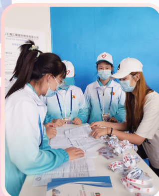
▲与志愿者们对接工作