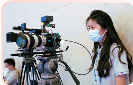
▲工作人员监督拍摄画面