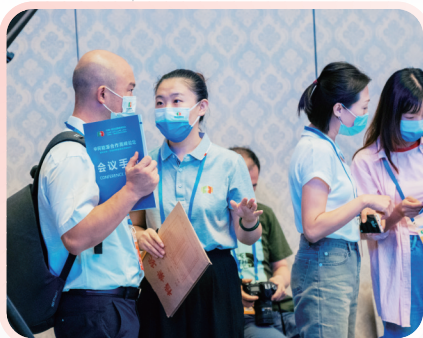
▲会议现场答疑解惑